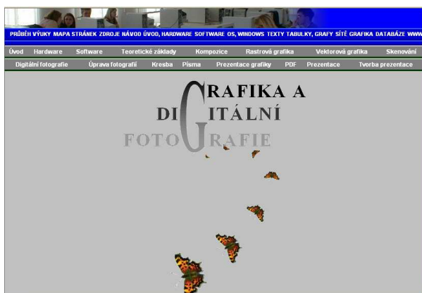
Obr. 4 Jedna z úvodních stránek hlavních tematických celků – Grafika a digitální fotografie