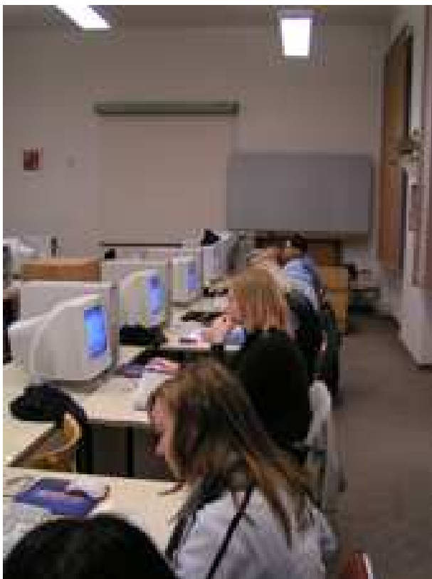
Obr. 6 Studenti při práci s aplikací v učebně výpočetní techniky