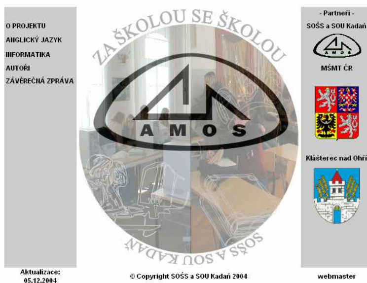
Obr. 2 Úvodní strana internetové aplikace